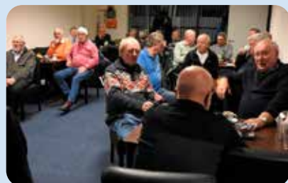
Veel gezelligheid in een vol clubhuis