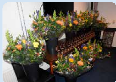
De bloemen en de beeldjes staan klaar